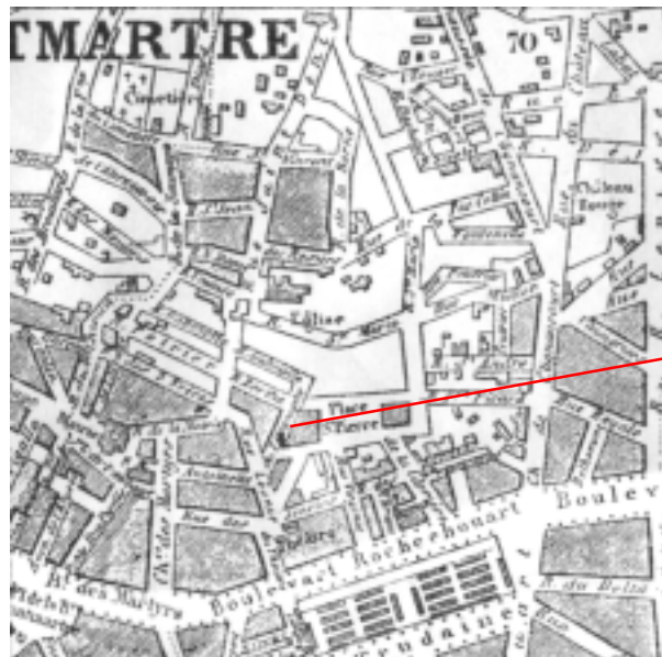
Plan G3 Butte Montmartre XVIII