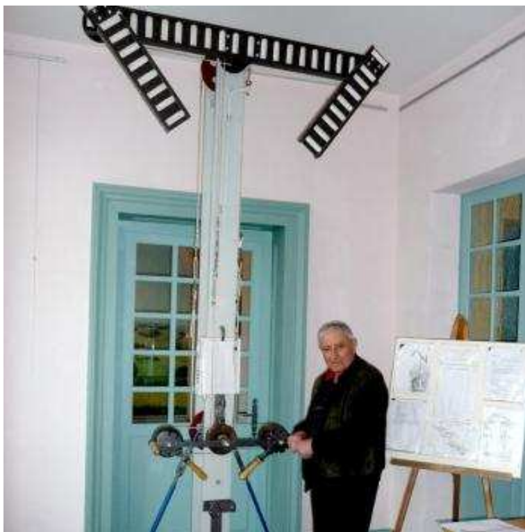
À partir de plans et recherches, JEAN BOIZON a su reconstituer ce dispositif original.