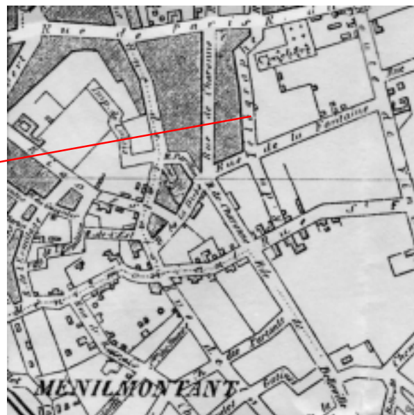
Plan K4 Mémilmontant XX